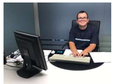
Eloi Porcel JG Associats