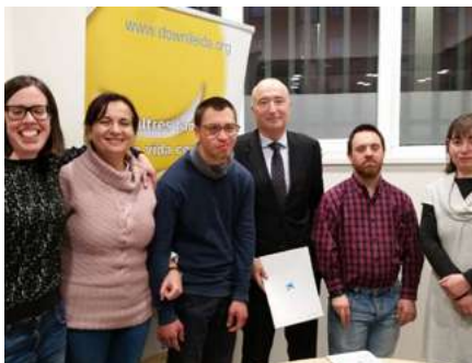
Obra Social "La Caixa"