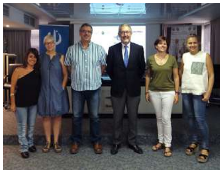
Ibercaja Obra Social