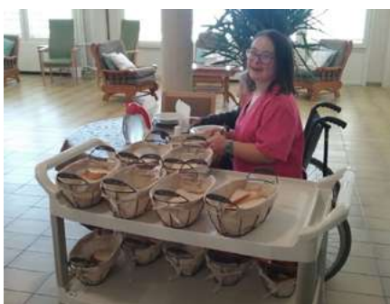
Ariadna Noya Centre Geriàtric Lleida

Joves en pràctiques laborals i noves insercions