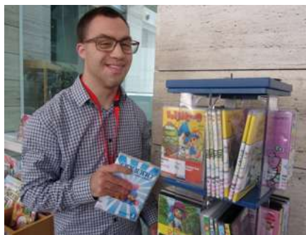
Jordi Fortuny Biblioteca Pública Lleida