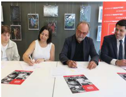
Ajuntament de Lleida i Fundación Mapfre